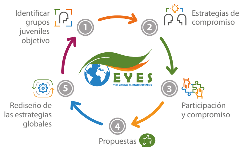
Imagen 2: Metodología aplicada

Como marco esquemático, la metodología global comprende los pasos siguientes: