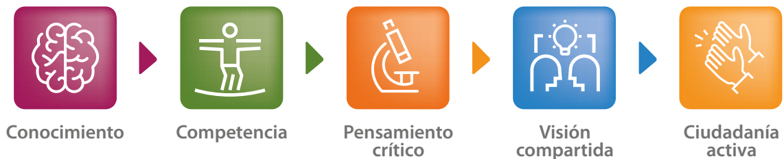
Imagen 3: Pasos en el desarrollo de ciudadanía activa.

Comprometer a la juventud puede ser un reto porque muchos ya están comprometidos con otras cosas (escuela, deportes, música, etc.) y sus circunstancias son raramente estables. Además, incluso para los más motivados e interesados en política y clima, trabajar con el ayuntamiento puede resultar extraño. En el caso de jóvenes vulnerables, los retos son todavía más grandes. Brevemente, la formación y las competencias fomentadas a través de la metodología de EYES se basan en estos pasos: