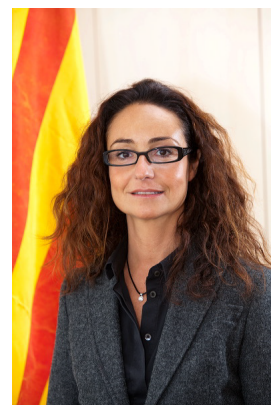
Maite Masià i Ayala Directora de l'ICAEN

Des de l'Institut Català d'Energia, esperem que aquesta guia continuï sent una eina útil per a la lluita contra la pobresa energètica a Catalunya i contribueixi a aportar coneixement pràctic i informació actualitzada als serveis socials sobre les possibles accions a prendre davant aquest problema social.